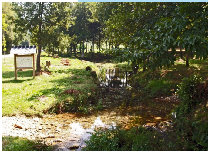
Área recreativa de Porto da Pena (Meira).