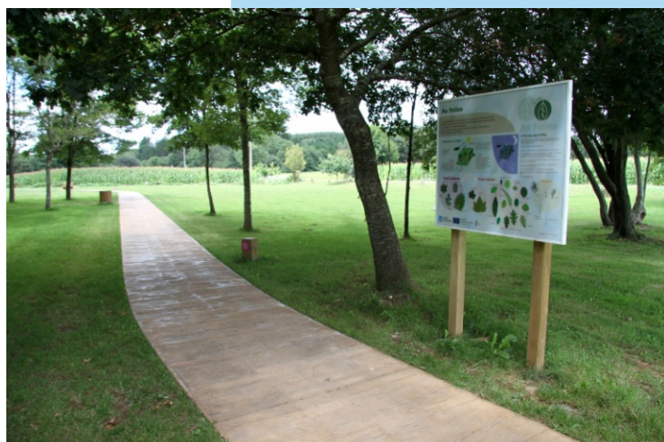
Área recreativa "Profesor Río Barja" en Meira.