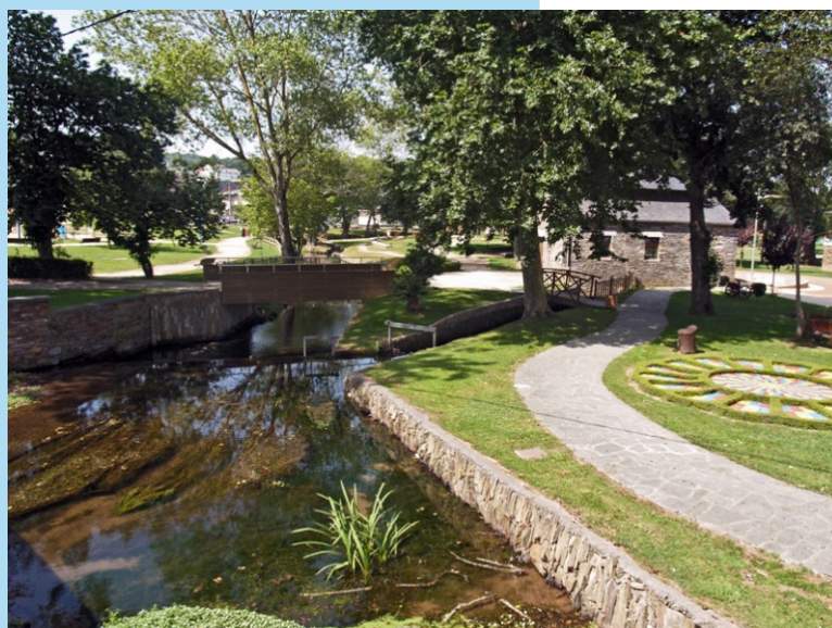
O Miño en Meira